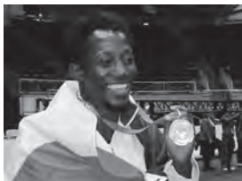
Moussa Niangane, première médaille d'or de l'histoire du wushu français, aux Championnats du Monde de Toronto en 2009